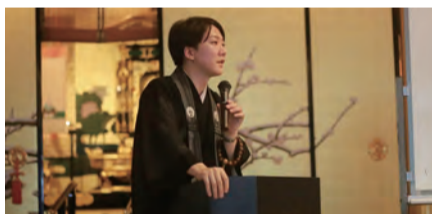
1 極楽寺で住職のお話