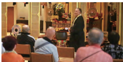
2 西念寺に到着後、住職のお話