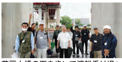
若戸大橋の下を歩いて渡船乗り場へ