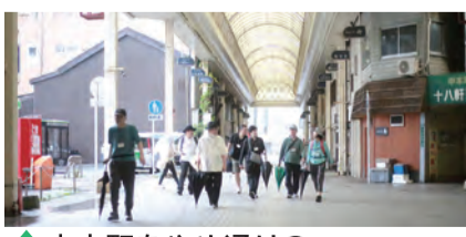
中本町あやめ通りのアーケードを通過して浄蓮寺へ

東筑組ホームページ「〇〇寺ってどんなお寺?」に各寺の歴史などが紹介されています。ぜひ一度ご覧ください。