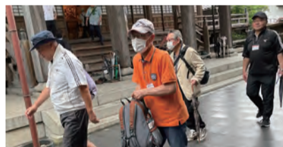
極楽寺をスタート!